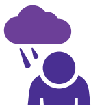
增加的恐惧或焦虑感