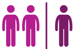
朋友或家人的孤立