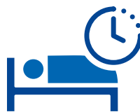
行为或睡眠的异常变化