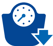
脱水或非正常的体重减轻