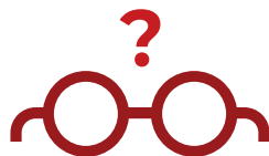
缺少日常生活用品 (眼镜、助行器或药物)