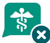
不被满足的医疗需求