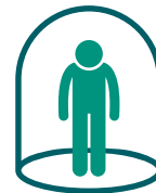
不再进行日常活动