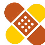
原因不明的伤口、淤伤、 切口或溃疡